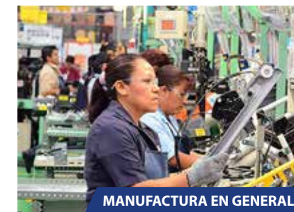
MANUFACTURA EN GENERAL

SAP® Certified Partner Center of Expertise